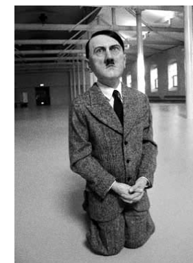
1. מאוריצי קטלן, Him, 2001